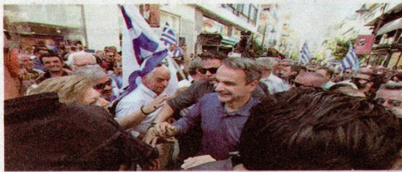
☛ Ο πρωθυπουργός θα γίνει δεκτός στο εκλογικό κέντρο

Ο Κυριάκος Μητσοτάκης έρχεται στην Αχαΐα και ήδη οι ετοιμασίες σε Αίγιο και Πάτρα βρίσκονται στην τελική τους ευθεία. Η ΔΕΕΠ Αχαΐας της Νέας Δημοκρατίας και η ΔημΤΟ του Αιγίου έχουν μεριμνήσει για κάθε λεπτομέρεια, προκειμένου η περιόδός του προωθη-